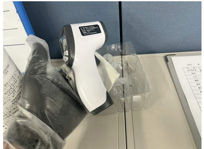
1階 事務所 体温計