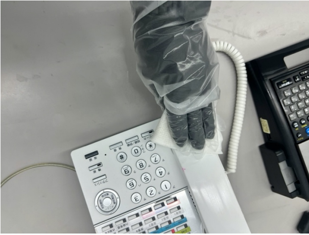
1階 事務所 電話