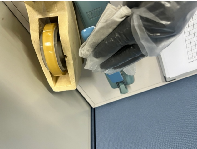
1階 事務所 事務道具