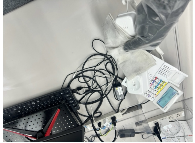
1階 事務所 電話 受話器